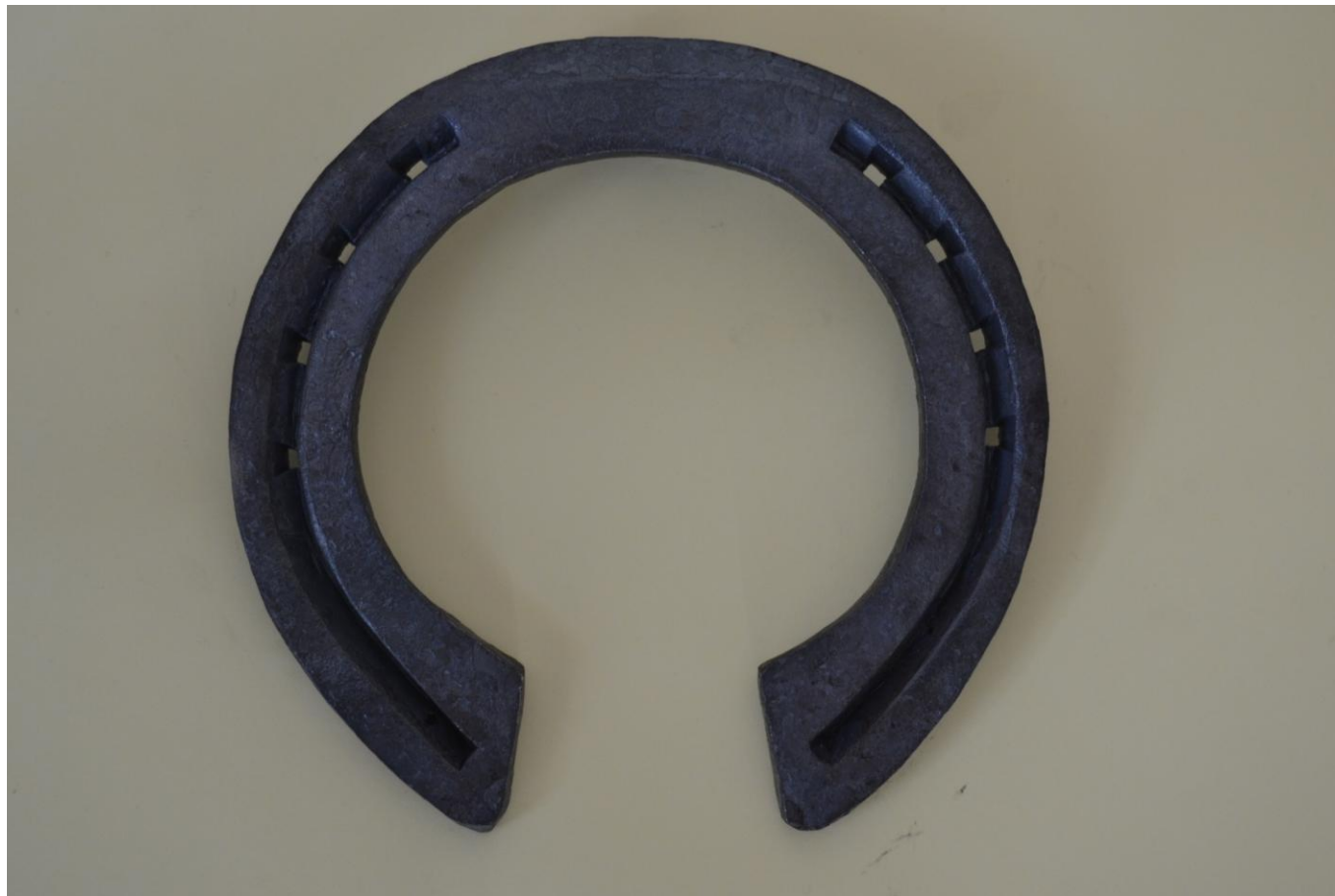
Œil de lynx - mécanique modifié - oignon 30